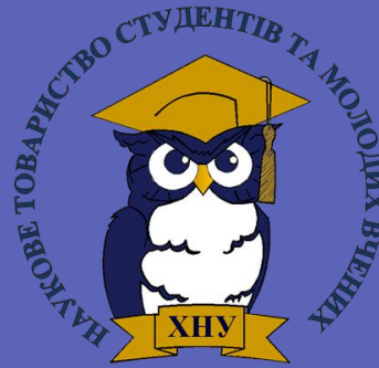
Рада молодих вчених при МОН