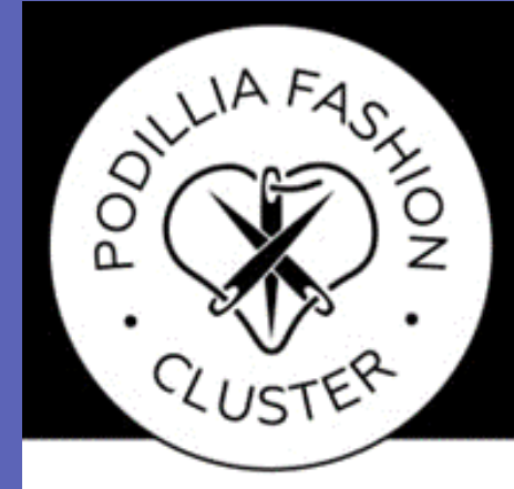
Участь у грантових програмах та проектах