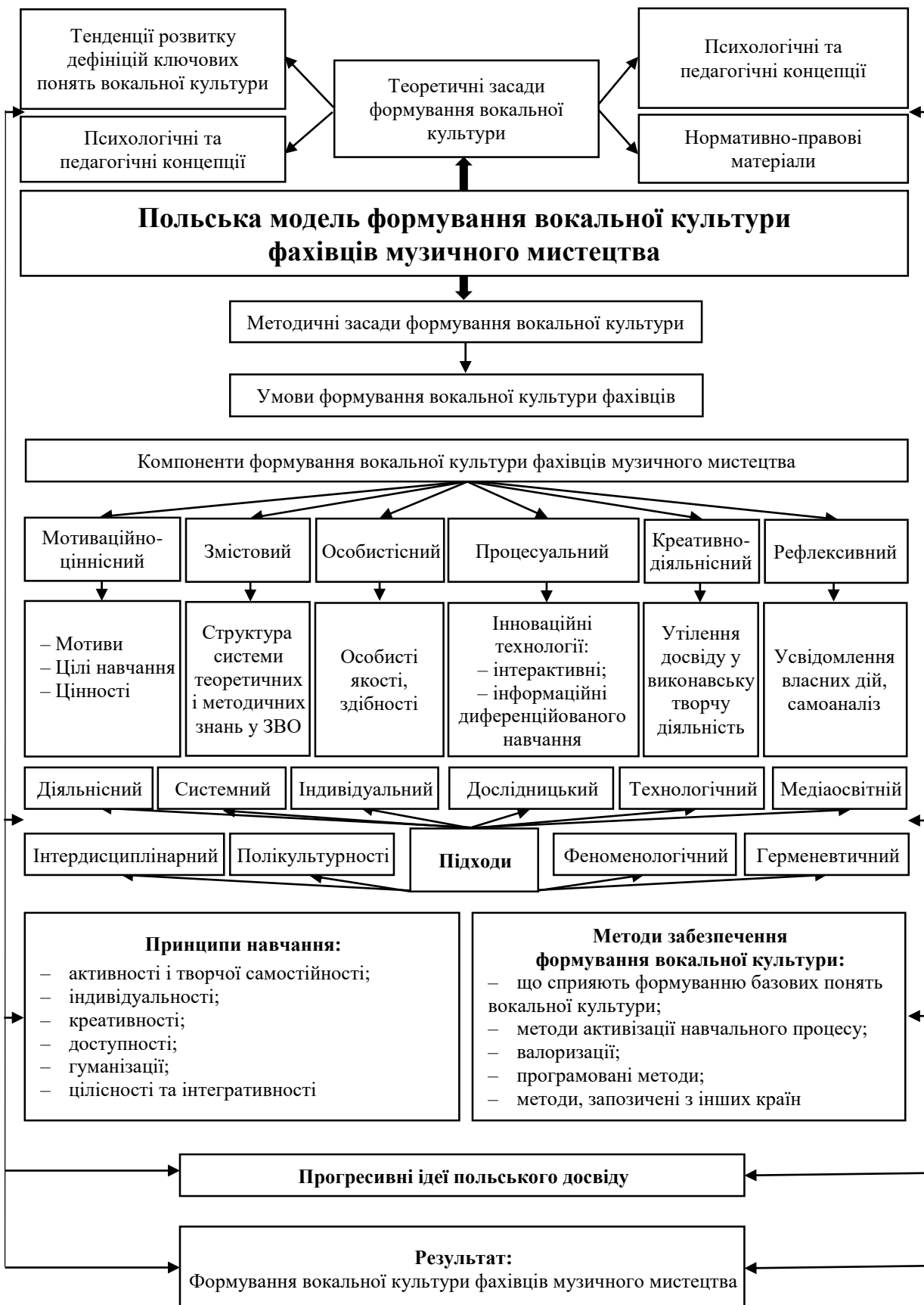
Рис 2.4. Педагогічна модель формування вокальної культури фахівців музичного мистецтва у ЗВО Польщі