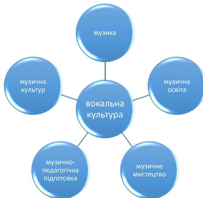
Рис. 1.1. Змістове поле вокальної культури