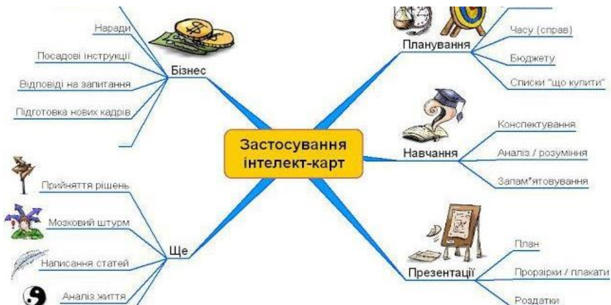
Рис. 2.1. Зразок застосування ментальної карти

Складники перцептивного процесу: суб'єкт (слухач або виконавець), тобто особистість, яка виявляє задатки, має поріг чутливості, індивідуально-психологічні особливості (слухацький досвід, рівень музичної освіти, потреби), що зумовлюють рівень сприймання музичного твору; об'єкт – музика як комплексний подразник (система звуків), що впливає на суб'єкт і викликає його реакцію (Лімін, 2011; Лімін, 2016).